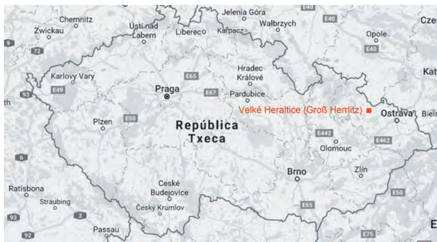
Situació relativa de Velké Heraltice (Groß Herlitz) a Txèquia.