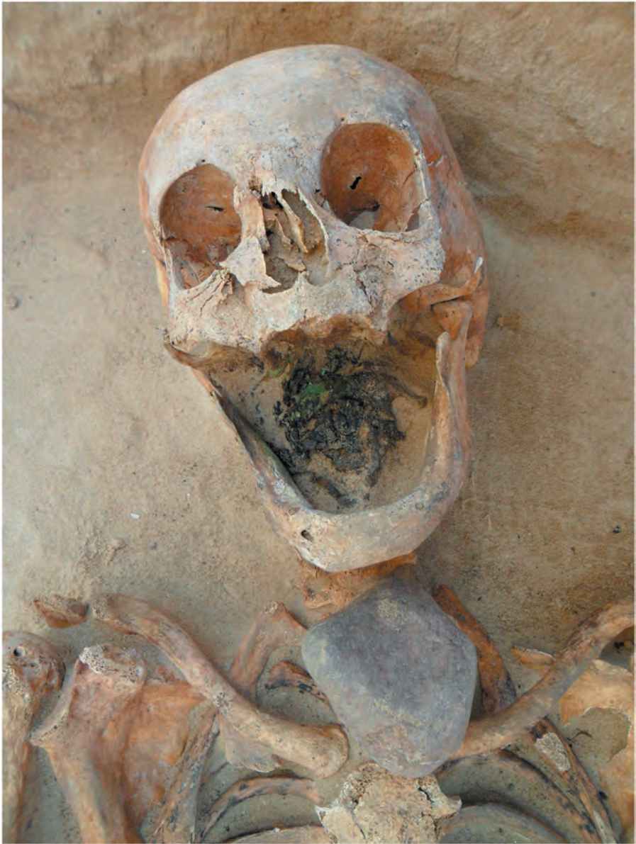
Figura 2. Individu 60/2010 (45-49 anys d'edat) amb una pedra col·locada directament a la part superior de la gola.