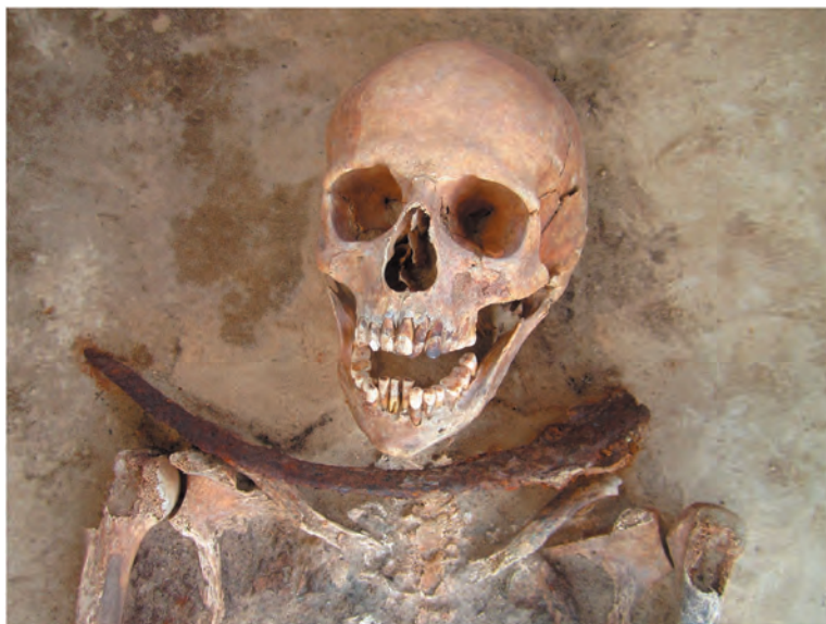
Figura 1. Individu 49/2012 (30-39 anys d'edat) amb una falç col·locada al coll.

2012), tres femelles adultes (24/2009; 60/2010; 49/2012), i un subadult de sexe desconegut (29/2008); tal diversitat demogràfica indica que les pràctiques mortuòries apotropàiques contra el vampirisme no estaven vinculades al gènere o l'edat. D'aquestes sis persones, cinc van ser enterrades amb una falç al coll o a l'abdomen, la intenció de tallar el cap o obrir-los la panxa si intentaven aixecar-se de la tomba. Dos individus també tenien grans pedres col·locades sota la barbeta, probablement com una mesura preventiva per a evitar que mossegués d'altres o per a bloquejar la gola perquè sigui incapaç d'alimentar-se dels vius. L'article mostra fotografies d'ambdues situacions i que aquí reproduïm gràcies a la sempre desitjable llicència Creative Commons de Reconeixement Genèrica (figures 1 i 2). Un punt important és que aquests enterraments no estan segregats en el cementiri, sinó que es troben al bell mig dels estàndards. D'altra banda les recerques bioarqueològiques que s'han desenvolupat a Drawsko 1 no han trobat patrons significatius de la malaltia, l'estrès o traumes que justifiquin els enterrament anòmals.