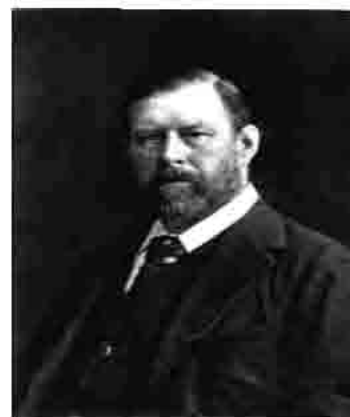
Imatge clàssica de Bram Stoker