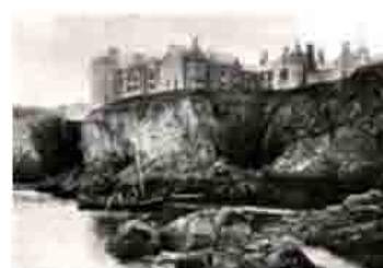
Grabat d'època del castell de Slains, a Escòcia.